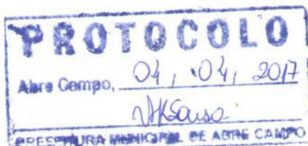
Márcio Moreira Vítor Prefeito Municipal